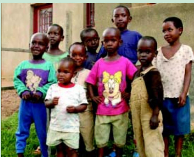
Діти Духумурізань зможуть виконувати домашнє завдання по ввечерах після того, як буде проведена електромережа.