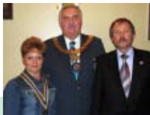
Знайомтеся: РК Полтава стор. 5