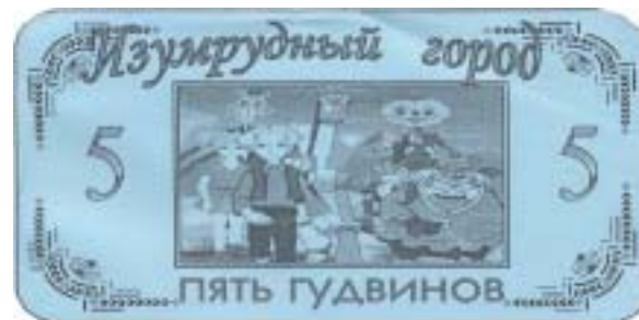
Курс гудвіна до національної валюти на Сорочинському ярмарку складав 1:10.