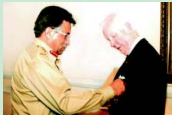
Президент Пакистану Первез Мушшараф нагороджує Президента Уїлкінсона медаллю Сітара-і-Ейсаар (Зіркою за Самовідданість). Нагорода вручена в лютому в Ісламабаді за надання допомоги після землетрусу і знаменує собою визнання благодійної діяльності Ротарі після трагедії в Кашмірі.

Молодіжні програми не поступаються за значенням перерахованим вище задачам Ротарі. «Робота з удосконалення і зміцнення наших про-