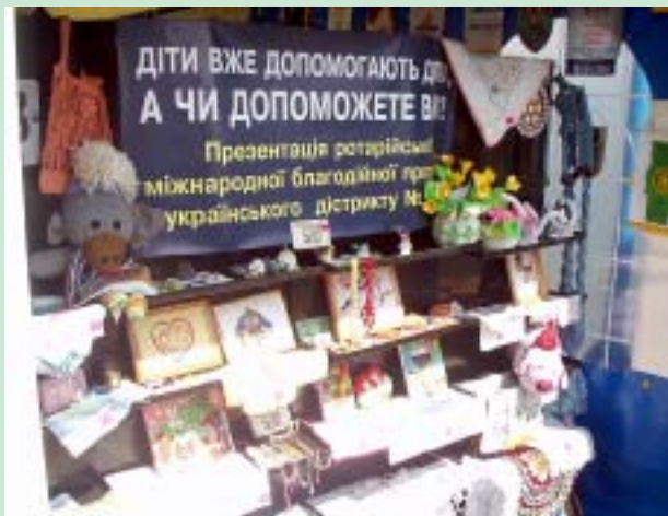
У якості лотів на ротарійському аукціоні виступали вироби дітей з інтернатів і дитячих будинків.

Безперечно, Сорочинський ярмарок - це одна з найбільш колоритних і видовищних подій світового масштабу. Яскравий фольклорний український колорит ярмарку в сполученні з торгівлею і діловою програмою щороку, як магнітом, притягає у серпні у Великі Сорочинці Миргородської області сотні тисяч людей.