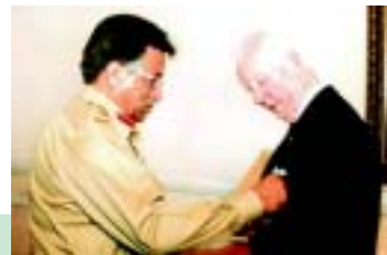
Ротарі діляться стор. 7