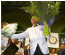
Вечір високого мистецтва стор. 4