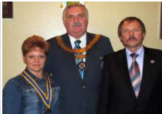
РК Полтава зустрічає губернатора, 2007р.