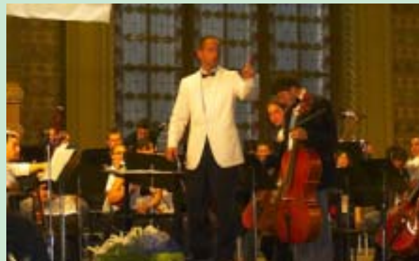
Молодіжний симфонічний оркестр «Лонг Айленд» під керівництвом молодого диригента Скотта Данна.

Концерт молодіжного симфонічного оркестру «Лонг Айленд» (Long Island Youth Orchestra) з Нью-Йорку - це подія. А концерт цього всесвітньо відомого музичного колективу в Ялті - подія подвійно визначна. Крим у період курортного сезону переповнений музичними і гумористичними заходами різного формату і масштабу, але концертами симфонічної музики кримчани і гості півострова не розбещені. «Значить, не затребувані!», – скаже хтось навздогін. Завдяки кримським ротарійцям, які організували концерт симфонічного оркестру в Ялті, молоді американські музиканти спростували судження такого роду виступом у переповненому концертному залі «Ювілейний» під нестихаючі вигуки «Браво!» і «На біс!».