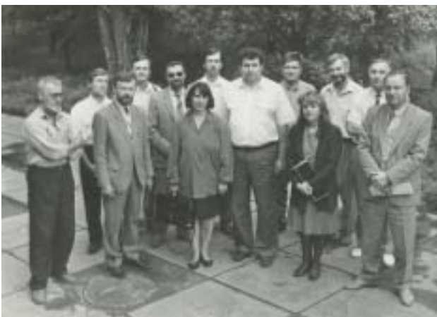
Ініціативна група зі створення Ротарі-клубу у Полтаві, 1996 р.